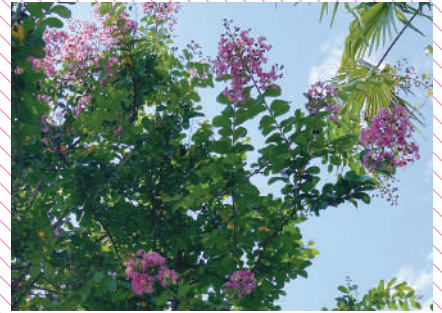
今年もピンクのサルズベリが綺麗に咲きました。

公式インスタグラムではリアルタイムの園のお花を公開中！ 詳細は、P.06をご覧ください！