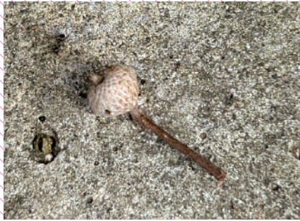
秋に向けてちっちゃな実をつけたどんぐり。