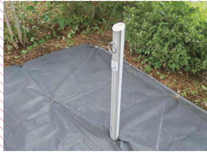
木陰にリードフックポール。これで暑い日も安心です。