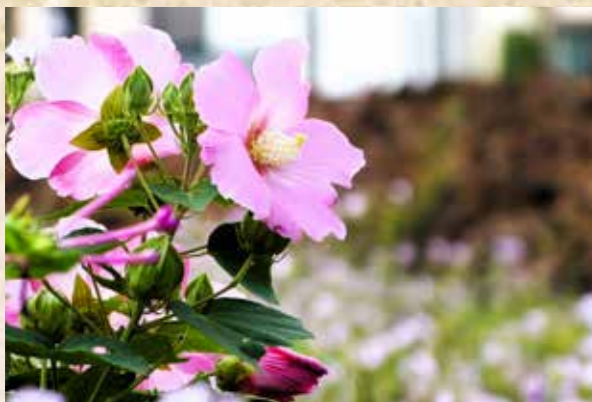
芙蓉の葉は、カエデや掌のような横広がり

簡単。見分けるときは「葉」を見ます。木槿の葉は、ギザギザと細長い形をしています。一方の芙蓉は、大きいカエデのように、横幅がある形です。また育ち方も、木槿は上に伸びやすく、芙蓉は横に広がりやすいといった違いがあります。「木槿は縦、芙蓉は横」と記録しておくとお役に立つかもしれません。品種も多いので、出会いのたびに喜びがある花です。この夏は、探梅ならぬ「木槿さがし」なんていかがでしょう。花期のながい木槿ならではの、夏の散歩のたのしみです。