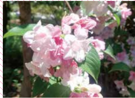
高さが2mにもなるウツギ。淡い色合いのかわいいお花です。