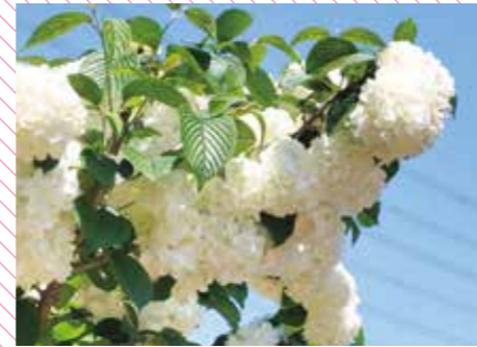
真っ白なオオデマリと青空のコントラストが爽やかです。

公式Instagramではリアルタイムの園のお花を公開中！ 詳細は、P.06をご覧ください！