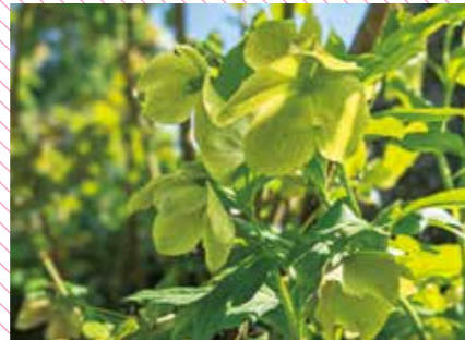
うつむき気味にひっそりと咲くクリスマスローズ。蕾も素敵です。