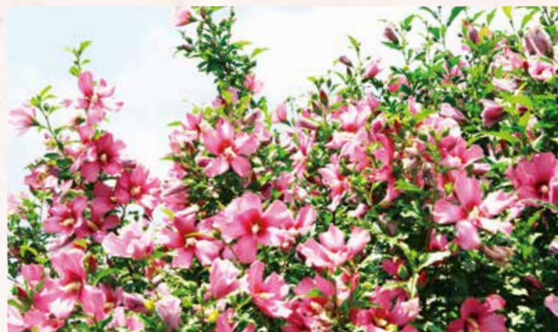
木槿は縦に伸び、葉はギザギザとして細長い