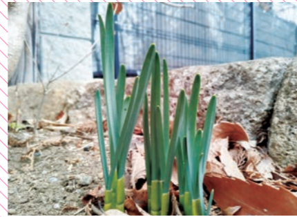
燈の水仙。春の訪れを首を長くして待っています。3月には見頃です。

公式Instagramではリアルタイムの園のお花を公開中！ 詳細は、P6をご覧ください！