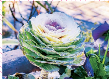
寒さをもものともせず葉牡丹が力強く咲いています。