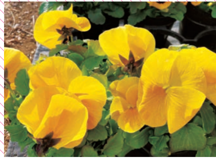
暖かな春を感じさせる黄色のパンジー。鮮やかな発色が印象的です。