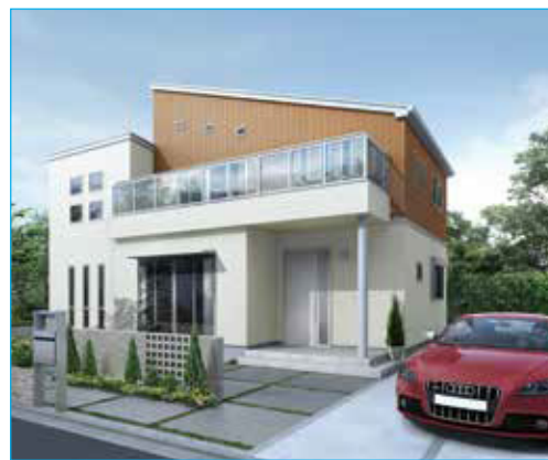
西武開発一戸建てシリーズ lifeism (ライフイズム)

地域に精通したアドバイザーが、 所沢西武霊園ご利用者様の 専任担当者として、 不動産のお取引を最初から最後まで 丸ごとサポートします。