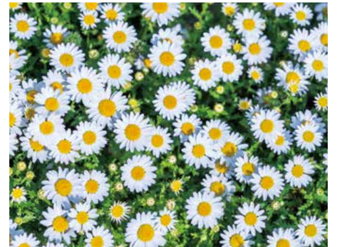
霊園の見頃 ● 3月下旬～4月中旬

「よく咲くスマイレ」という名の品種。華やかさと強さ、2つの特徴をパンジーとビオラから受け継いでいます。花言葉は「田園の幸福」「慎ましい喜び」。