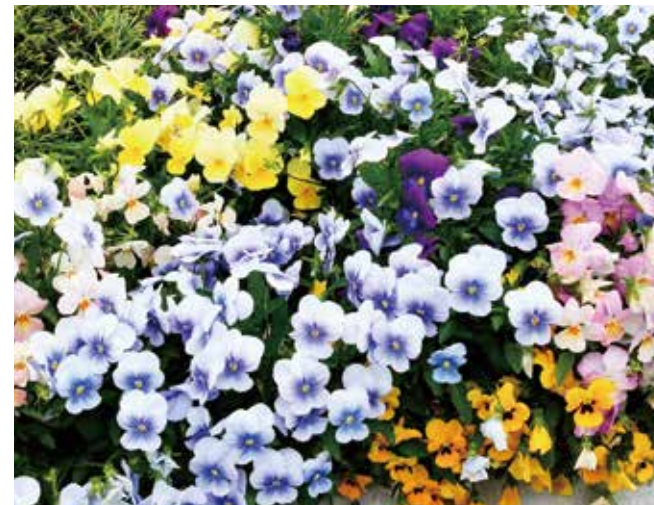
霊園の見頃 ● 3月下旬～4月中旬