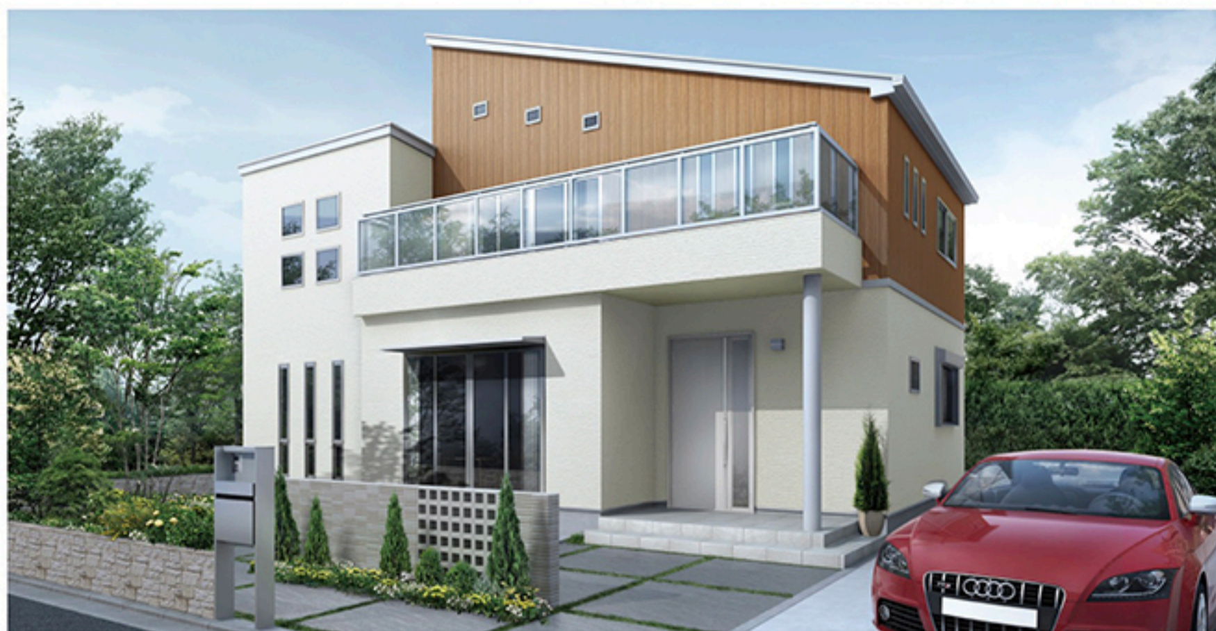
西武開発一戸建てシリーズ lifeism (ライフイズム)